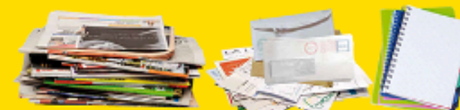
Journaux, magazines, publicités, enveloppes, courriers, cahiers...

JE N'EMBOÎTE PAS LES EMBALLAGES, JE LES DÉPOSE EN VRAC ET BIEN VIDÉS.