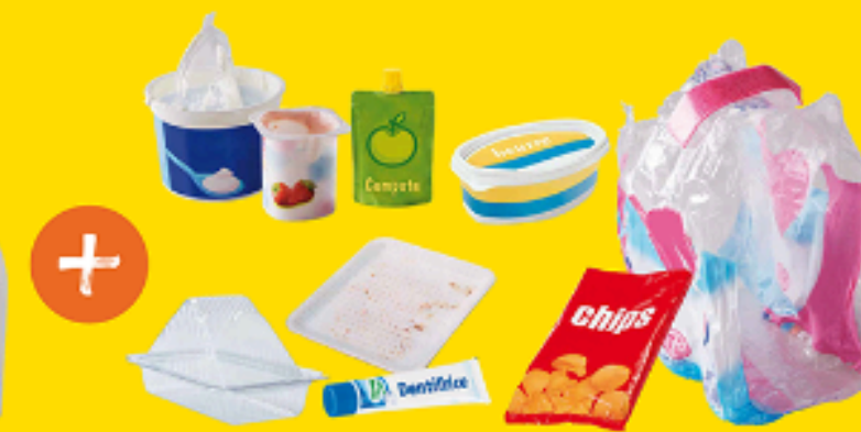
Pots, gourdes, tubes, sachets et films en plastique, barquettes en plastique et en polystyrène...