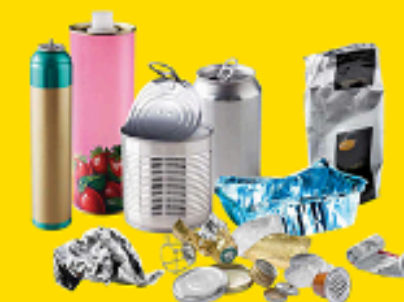
Emballages métalliques y compris les petits